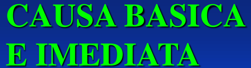
TABELA E CONCEITO IDENTICO AO DO ROA.