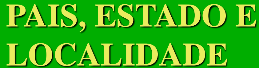
TABELA E CONCEITOS IDÊNTICOS AO DO ROA.